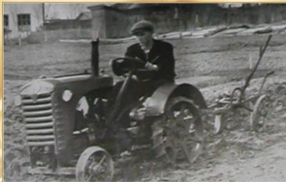
Трактор Т-10. Использовались детали от старого автомобиля ГАЗ-ММ, ГАЗ-А, трактора ДТ-54, самолета У-2, мотоцикла М-72.