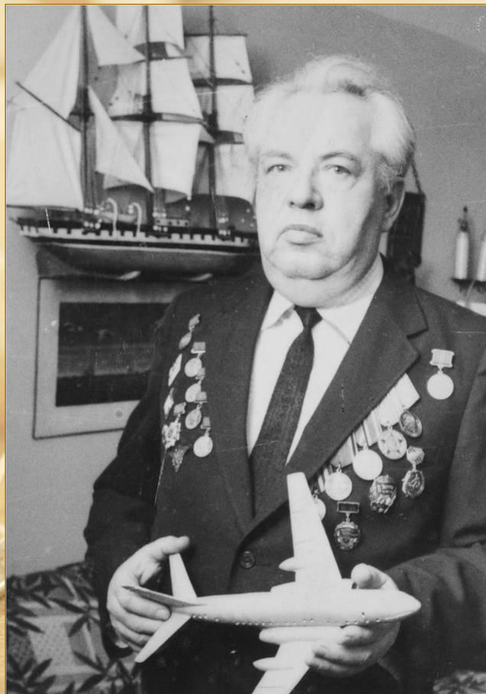
С экспонатами музея