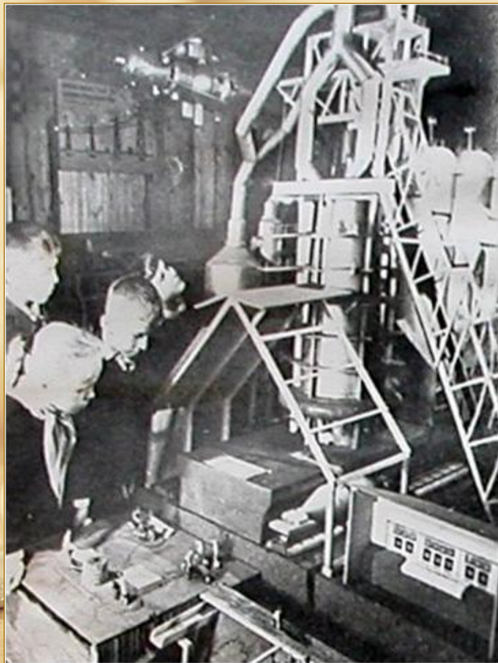
Модель процесса изготовления хлеба от зерна до буханки