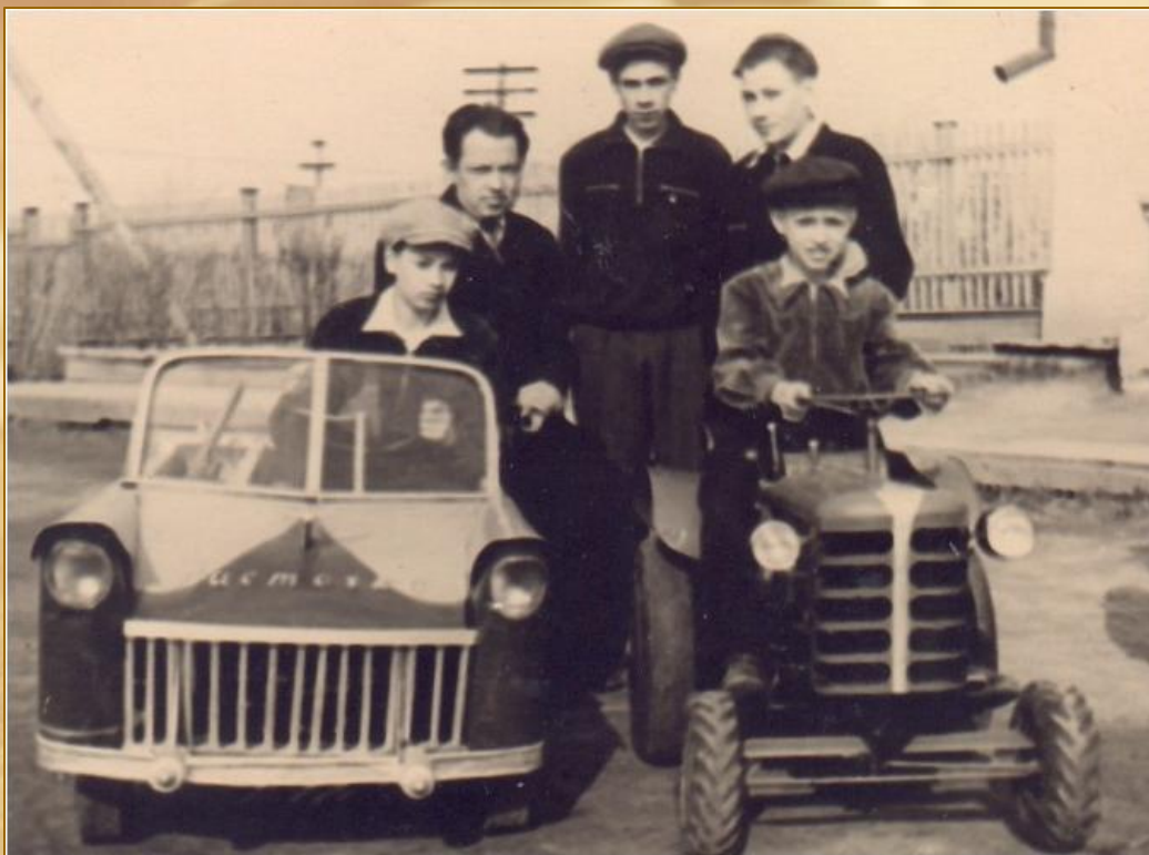
Машины, созданные кружковцами