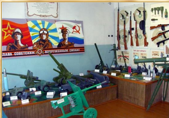
В зале «Оружие Победы»