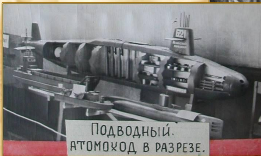
ПОДВОДНЫЙ. АТОМОХОД В РАЗРЕЗЕ.